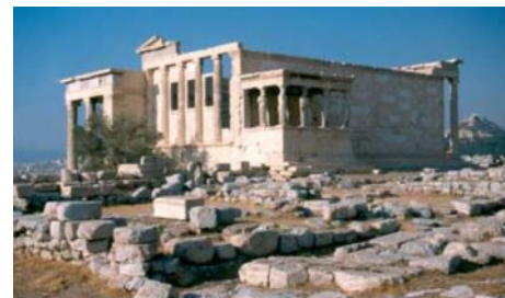
- ATHENES - TEMPLE -

J9, mercredi 31 mars 2010, ATHENES : visite guidée d'Athènes. Tour panoramique pour admirer les principaux monuments de la capitale : l'Université l'Académie, la bibliothèque, la place Omonia, la place Sintagma, le stade de marbre Pierre de Coubertin. Visite du rocher sacré de l'Acropole et de son nouveau musée . Déjeuner en taverne. L'après-midi, visite de l'agora et temps libre pour promenade à Plaka , l'ancien quartier connu pour ses ruelles typiques et son marché aux puces. Dîner et logement à Athènes.