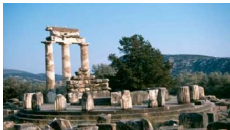
- DELPHES -

le sol. L'institution officielle des jeux olympiques date de 776 av. J.-C. Célébrés en l'honneur du dieu des lieux, Zeus, ils s'y déroulèrent pendant 1 200 ans, tous les quatre ans. C'est d'ici que part la flamme sacrée pour inaugurer nos jeux modernes. Déjeuner à Olympie puis continuation vers Delphes via Patras , pour prendre le pont entre Rion et Antirion . Dîner et logement à Delphes.